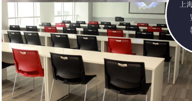
上海外国语大学 贤达学院 教学环境